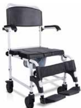
Silla Ducha Inodoro Aluminio con Reposapiés y Ruedas