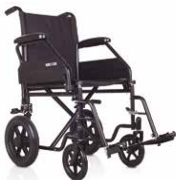
Silla de Ruedas Plegable Acero - Ruedas Pequeñas