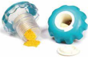
Trilladora de Pastillas