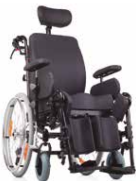
Silla de Acero Respaldo Alto Reclinable Ruedas Grandes