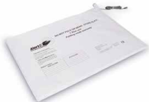
Alfombra Detección Cama