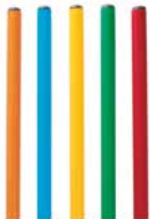
Juego de Picas