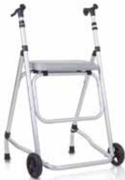
Andador Básico Aluminio