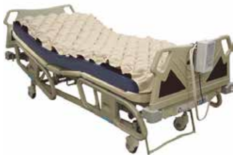
Colchón Antiescaras Kit Completo