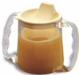
Vasos con dos Asas