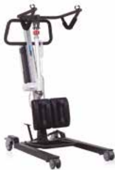
Grua de Bipedestación