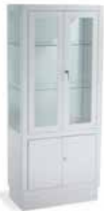
Vitrina de 1 Puerta Con Cerradura