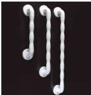
Asidero de Plástico Largo 60