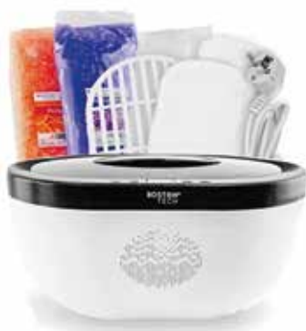
Baño de Parafina