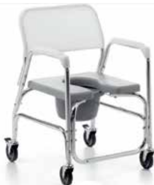
Silla Inodoro Con Ruedas y Asiento Herradura