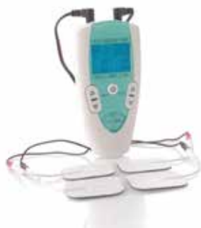
Tens Digital 2 Canales