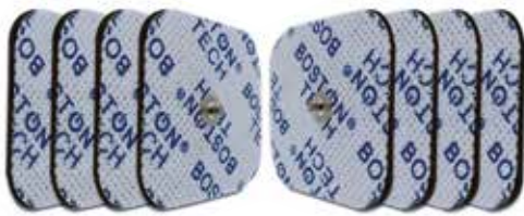
Electrodos para Tens