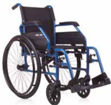
Silla de Aluminio Mod Sol Ruedas Grandes