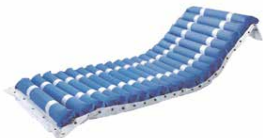
Cojín Antiescaras Proceso Celdas de Aire