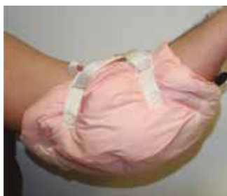
Codera acolchada Color Azul