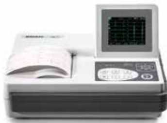
Electrocardiógrafo de 3/6 Canales Con Interpretación