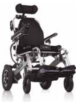
Silla Eléctrica Modelo; Martinika