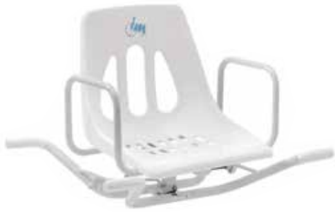
Silla de Baño Giratorio Modelo: My Bath