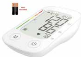
Tensiometro Digital Brazo