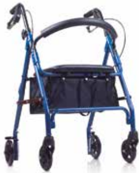
Rolator con Asiento, Cesta y Respaldo Frenos de Maneta