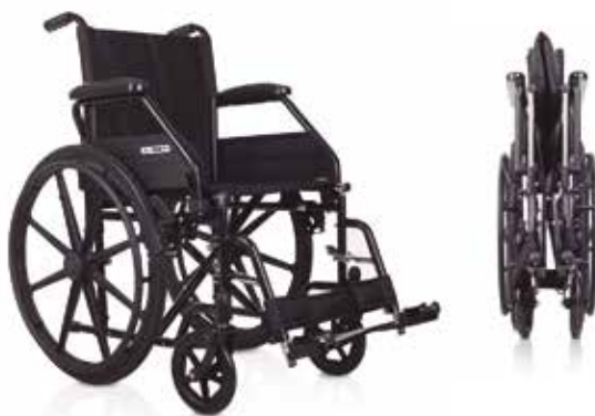
Silla de Ruedas Peglable en Acero Ruedas Grandes