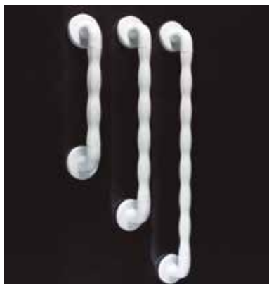
Asidero de 90 cm