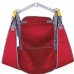
Arnés para grúa de Traslado