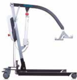
Grúa de Traslado Peso inferior a 150 kg Modelo; Aupa