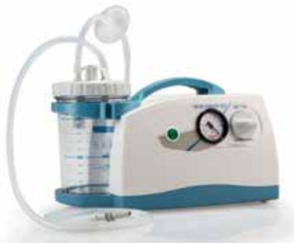
Aparato Aspirador Secreciones