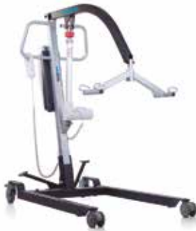
Grúa de Traslado Peso Superior a 150 kg