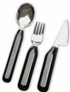
Juego de Cubiertos Engrasados