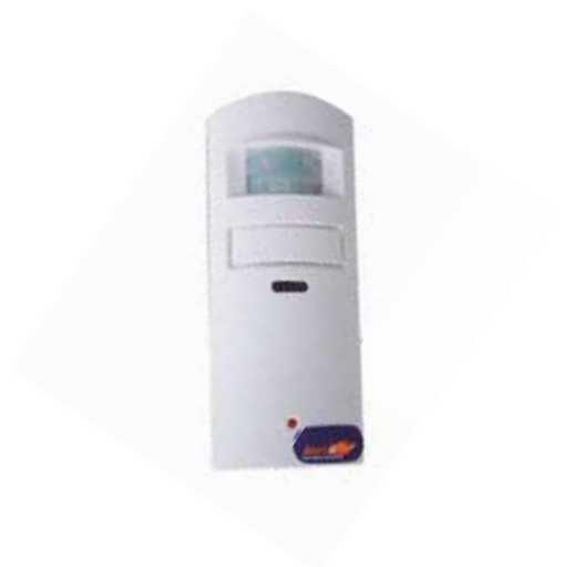
Sistema Vigilancia Salida de la habitación