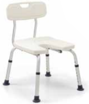
Silla Taburete Baño