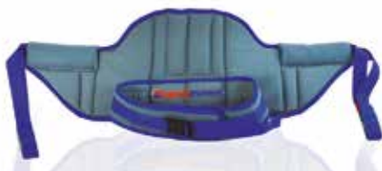
Arnés para grúa de Bipedestación