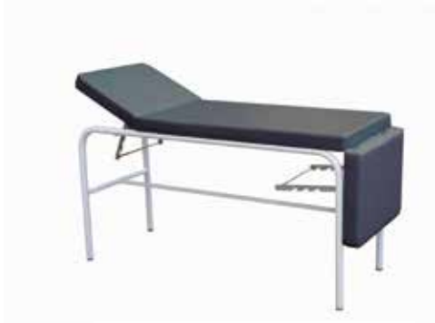
Camilla de Reconocimiento Acero Fija