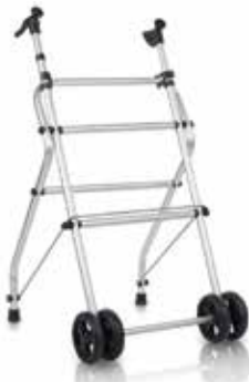
Andador Paso a Paso Aluminio Ligero