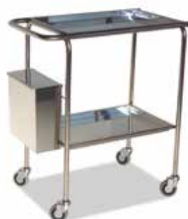
Carrito de Curas