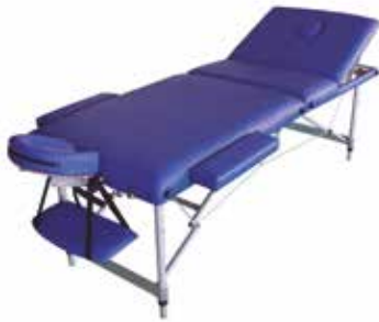
Camilla de Reconocimiento Plegable y Regulable