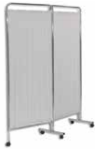
Biombo Dos Cuerpos