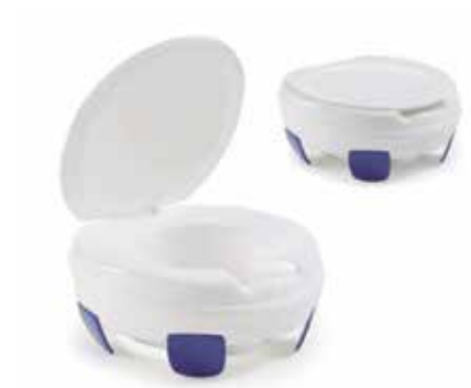
Elevador para WC Con Tapa