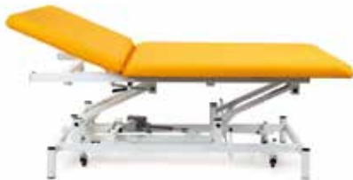
Camilla Eléctrica de Reconocimiento