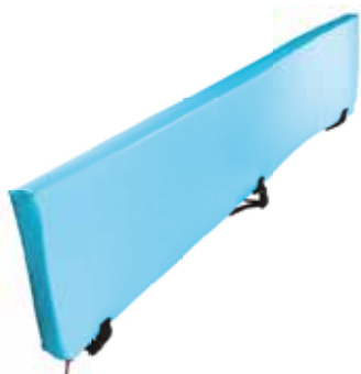
Protector de barandillas con PU