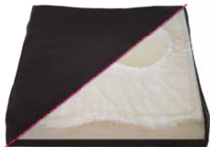
Cojín Antiescaras de Gel Con funda de PU Complex