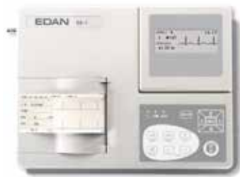
Electrocardiógrafo de 1 Canal Con Pantalla LCD