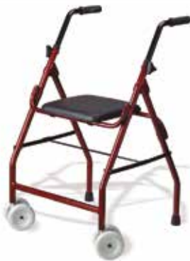
Andador Básico Con asiento