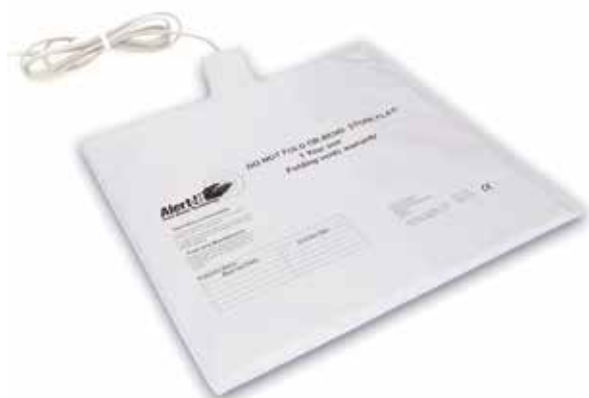
Alfombra Detección En Suelo