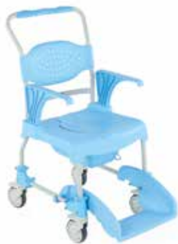
Silla de Baño Modelo: Moem