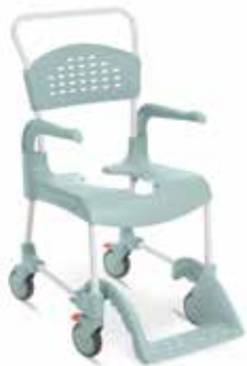
Silla de Baño Modelo: Clean