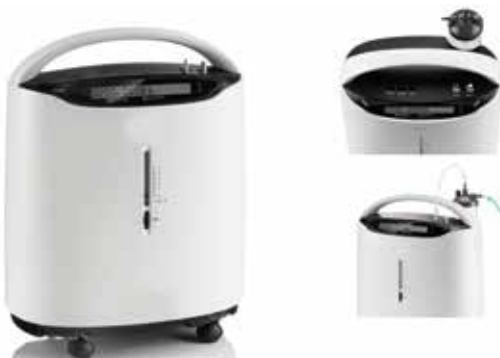
Concentrador de Oxígeno