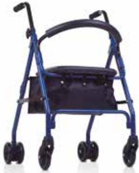
Rolator con Asiento, Respaldo y Cesta Freno por Presión