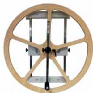
Rueda de Hombros