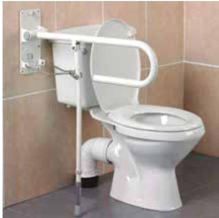
Asidero Forma L Plástico Estriado